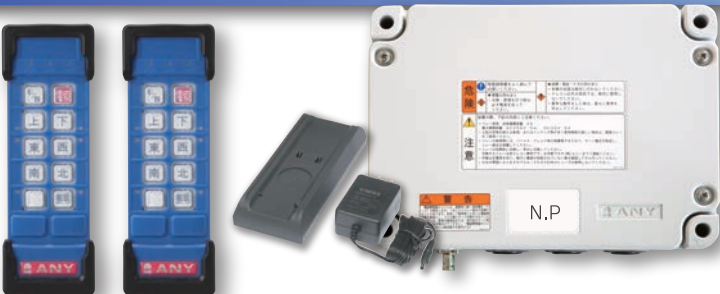
※写真はFSH2100DWZの構成となります。