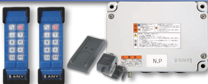
※写真はFSH2100DVZの構成となります。