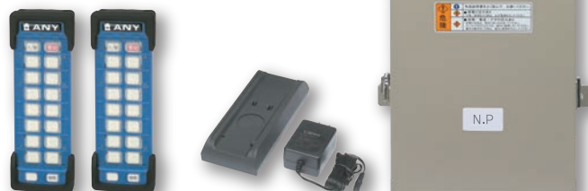
※写真はFSH2180EVZの構成となります。