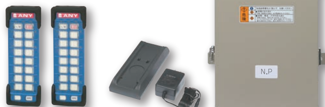
※写真はFSH2180EWZの構成となります。